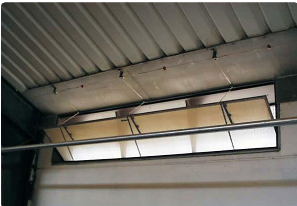
Ljusklaff installerad i ett stall.